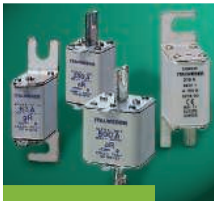
Fusibili NH a standard DIN 43653