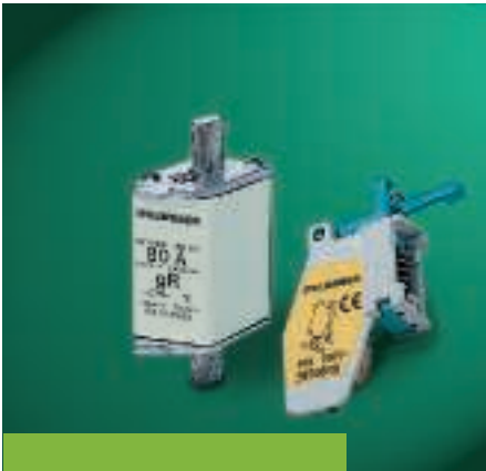
Fusibili NH a standard DIN 43620

limita la corrente di picco in funzione del valore efficace della corrente presunta di cortocircuito. Anche i dati presenti in questo grafico rivestono particolare importanza, in quanto definiscono la capacità di un fusibile di limitare la corrente di picco che potrebbe essere raggiunta durante il cortocircuito.