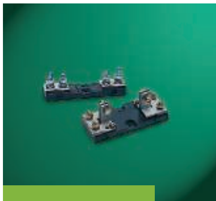
Basi portafusibili per fusibili con fissaggio a bullone

2) Grafico della corrente limitata (cut-off characteristic): indica di quanto il fusibile